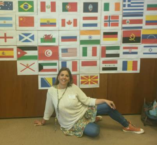
Na 1ª Conferência Mundial de PNL